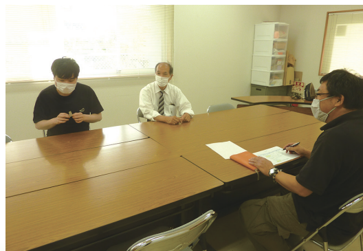
モニタリングの様子

ご依頼のあった方に対し、心身の状況や置かれている環境、サービス利用に関する意向その他の事情を考えて、最適のサービスを受けることが出来る様お手伝いします。