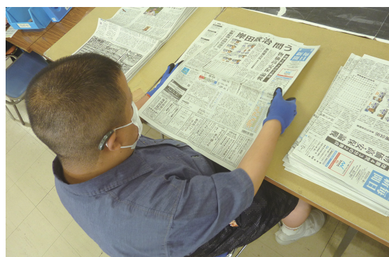
新聞仕分け（緩衝材用）